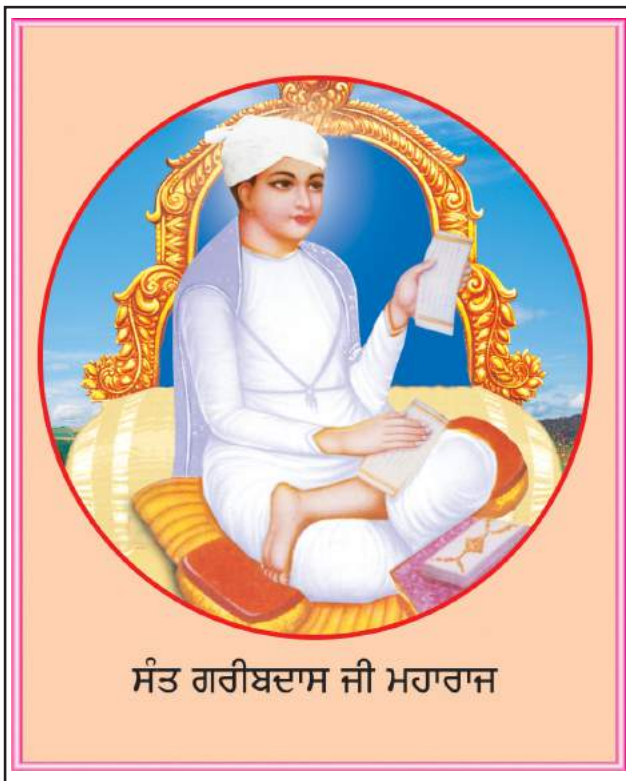
ਸੰਤ ਗਰੀਬਦਾਸ ਜੀ ਮਹਾਰਾਜ